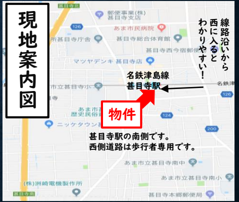
カーナビに「あま市甚目寺町郷浦147番6」と入力ください。