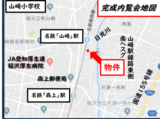
「稲沢市祖父江町山崎塚西11番1」ナビにてご検索ください。

＜不動産の売却、ご相談ください＞ 不動産の売却等には 媒介契約 が必要です。 専任媒介 いただけるお客さま限定