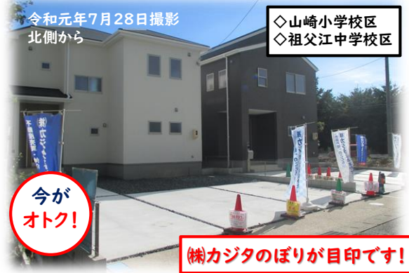
令和元年7月28日撮影 北側から